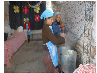
Cocina comunitaria.

El grupo debe presentar en la DPA una copia de las planillas de aportes familiares, los cuadernos de registro de menú y gastos, actas de reuniones y cuadernos grupales de ahorro. 📌