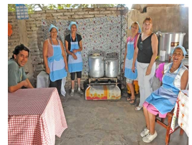
Cocina comunitaria.

Si bien cuentan con el soporte técnico de trabajadores sociales y nutricionistas que los acompañan y asesoran, las decisiones relacionadas con la administración de la cocina y los alimentos elaborados, se toman de manera consensuada, a nivel intra-grupo. 🇦🇷